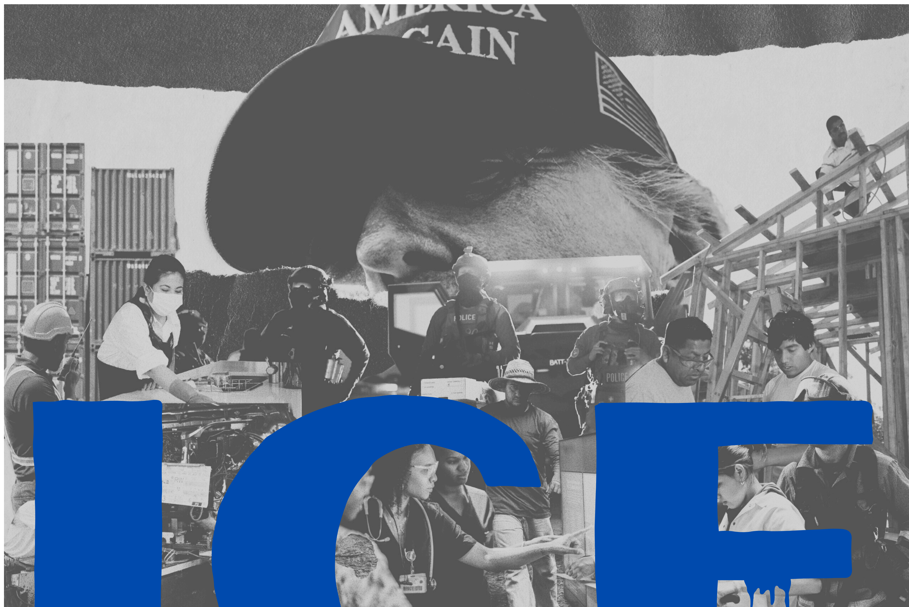
Illustration by Tevy Khou

13 DE ENERO, 2026 5PM - 7PM CENTRO CULTURAL EN MERRILL, UC Santa Cruz y En línea